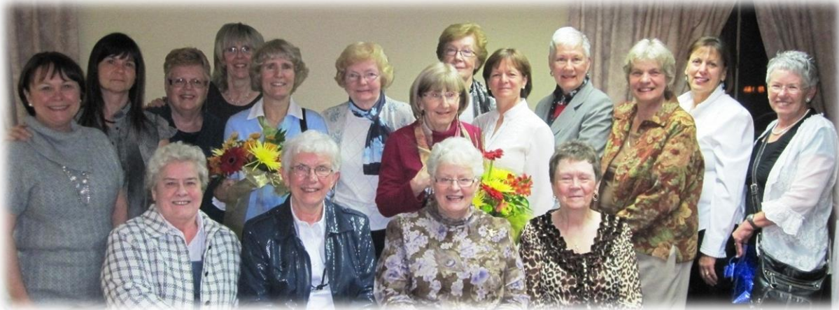
(Photo prise en l'honneur du 400 e anniversaire de naissance du Père Médaille, octobre 2010)